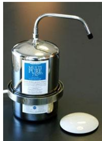
MP 750SSCT mit SENSEH®-Energiekeramik