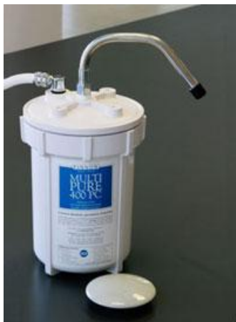
MP 400PC mit SENSEH®-Energiekeramik