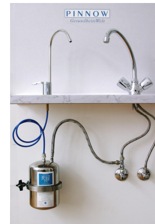
MP 750SB mit SENSEH®-Energiekeramik